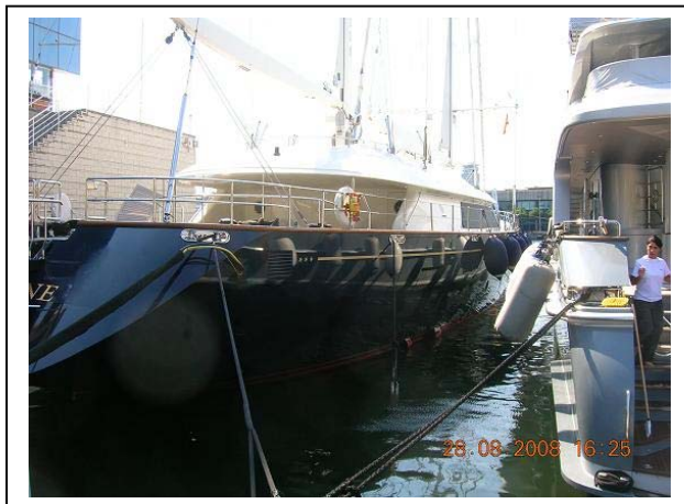
Det är sådana båtar, som allt byggs upp för.

Några hektiska dagar ägnade vi oss åt avrusta Fejm. Hon kommer att anlända till Herstaberg i mitten av vecka 38. Vi har mycket arbete framför oss med att få bort det bruna på bordläggningen och all rost på och omkring beslag.