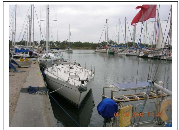
Sista förtöjningen i Medelhavet – lyftkranen nästa i Port Napoleon.