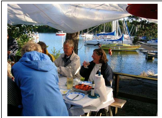
Det enkla och småskaliga vi längtade efter!

Båtlivet i Medelhavet och framför allt i Spanien är helt inriktat på lyxbåtarna. Motorbåtarna är gigantiska. Vi passar inte in där men får ändå dela kostnaderna.