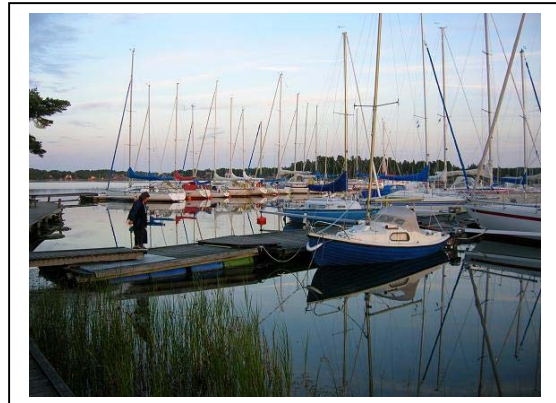
Mycket bättre än en lyxig marina!

Vi har aldrig sett så mycket tiggare och utslagna människor i detta lyxbåtarnas paradys. Handikappade människor dominerar bland tiggarna. Det berörde oss illa!