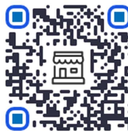
PayPal QR-kod för betalning av hamnavgift, bastu mm.