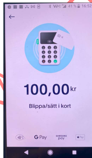
5. Telefonen visar att det är dags

Lösenord för inloggning till Zettle-kontor och PayPal-kontot finns tillgängligt för hamnkaptenerna.