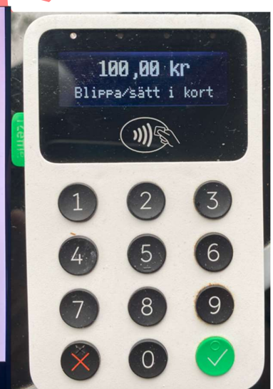
5. iZettle väntar på betalkortet