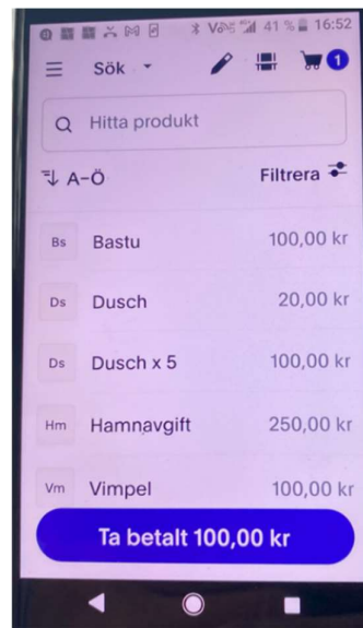
3. Välj produkt och klicka på ”Ta betalt ... kr”

Om beloppet är stort kan gästen behöva knappa in sin PIN-kod.