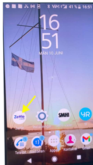
2. Starta appen Zettle